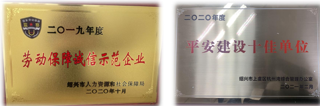
图 3.3-1 社会认可的证书（示例）