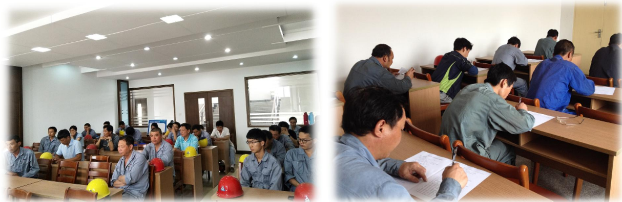
图 3.2-1 各类培训活动

公司每年针对实际和市场形势，识别各部门的培训需求，制定员工培训规划和年度计划，开展职工教育培训，包括质量意识、质量知识、管理制度、专业知识等培训内容。公司每年制定并下发了《年度培训计划》等，对质量诚信教育进行了安排布置。