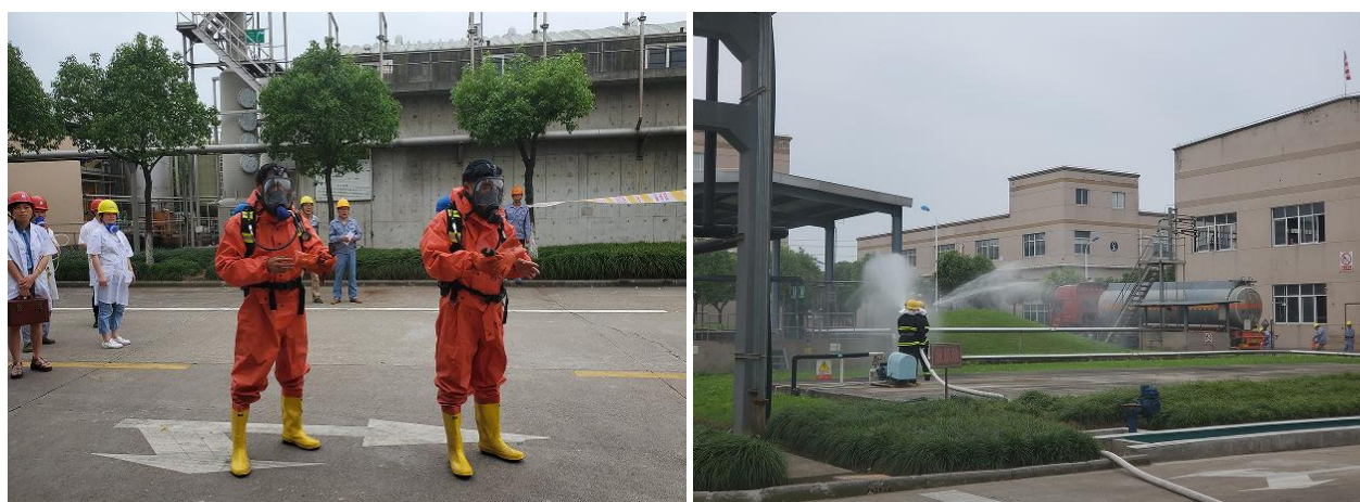
图 6.3-01 《化学品泄漏事故应急预案》演练现场

公司每年举行消防演练和各种灾害应急演练。公司制订了《配电房火灾、爆炸应急预案》等应急预案、《触电事件应急预案》、《重大设备故障应急预案》等应急处置方案等，对火灾、机械、触电等均有相应的应急措施，并成立了应急指挥中心和应急救援专业组。